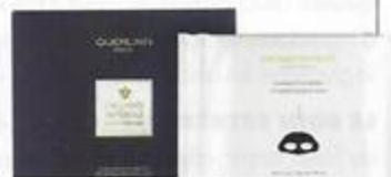
Le masque éclat impérial Orchidée Impériale Brightening, de Guerlain (355 $ les quatre masques).