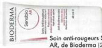
Soin anti-rougeurs Sensibio AR, de Bioderma (28 $).