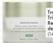
Traitement Triple Lipid Restore 2:4:2, de SkinCeuticals (140 $).