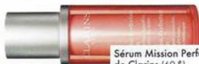
Sérum Mission Perfection, de Clarins (69 $).